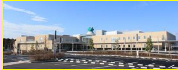
病院は2年前に高台に新築移転

日時; 2017年12月15日 17:00~19:00 場所; 宮城県南三陸町 南三陸病院研修室 テーマ; 誤嚥を防ぐポジショニングと食事ケア 参加者; 南三陸町及び周辺地域の多種種 当初予定30名⇒50名⇒最終は97名